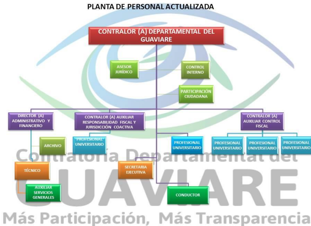
Ilustración Organigrama Contraloría Departamental del Guaviare

La Estructura Orgánica de la Contraloría Departamental del Guaviare, se encuentra conformada de la siguiente manera: